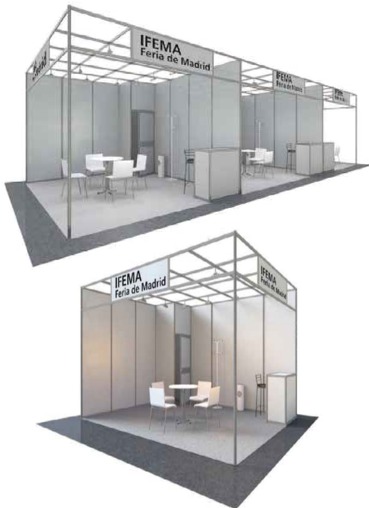
Stand llave en mano "todo incluido" Modular BASIC

DIBUJO ORIENTATIVO: No está permitido agujerar o clavar elementos en el stand. Es posible usar cinta adhesiva o gráficas, que sean fácilmente removibles y no deterioren los paneles.