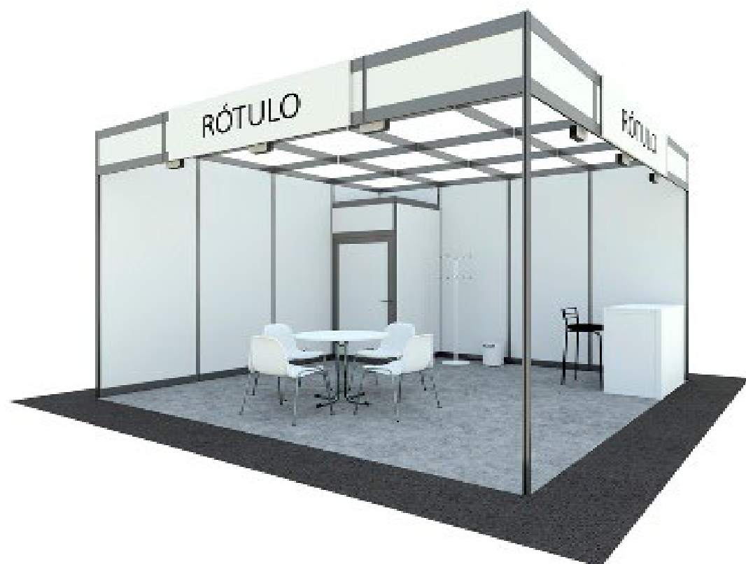
Stand llave en mano “todo incluido” Modular BASIC