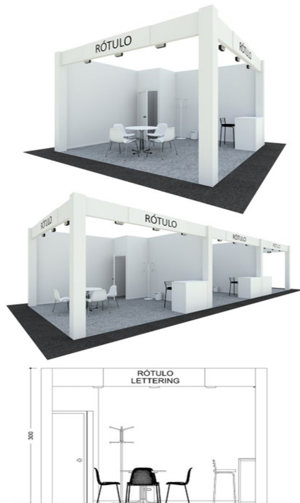
Stand llave en mano “todo incluido” Modular PREMIUM

DIBUJO ORIENTATIVO: No está permitido agujerar o clavar elementos en el stand. Es posible usar cinta adhesiva o gráficas, que sean fácilmente removibles y no deterioren los paneles.